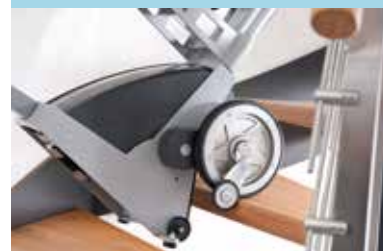
Meccanismo di stop al gradino