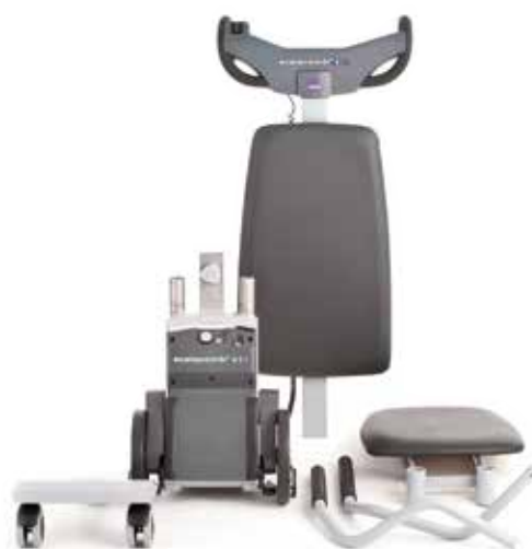
T10 smontato in 6 pezzi