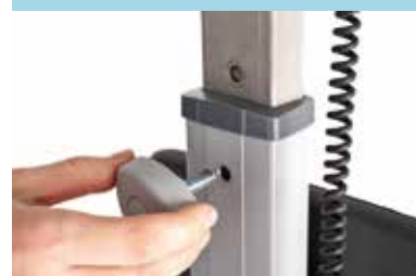
Regolazione altezza timone